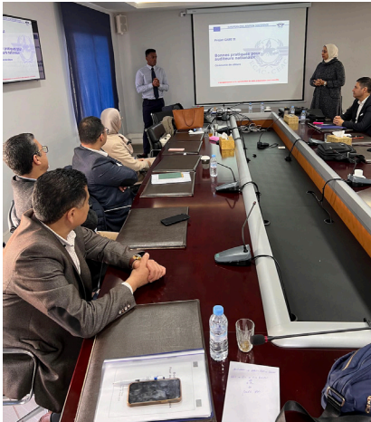
L'un des instructeurs et les participants lors de la session théorique au quartier général de la DGAC.

La formation a été dispensée en français à un groupe de participants issus de la DGAC, de l'exploitant