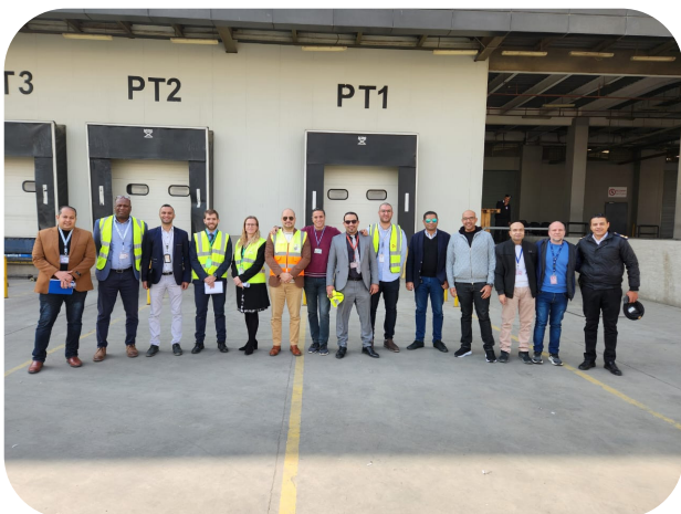
Photo de groupe durant l'exercice pratique - participants et instructeurs

L'équipe du projet CASE II remercie ses collègues du Caire d'avoir accueilli à deux reprises ses experts pour la formation et nous nous réjouissons de continuer à élargir notre partenariat dans les mois à venir avec d'autres activités.