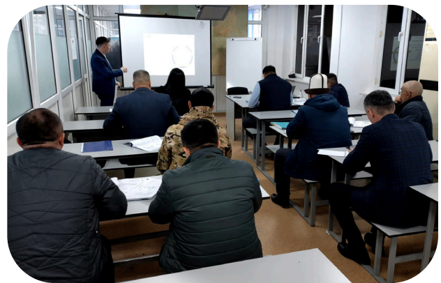
Les participants et un expert lors d'un module en classe.

Ce large éventail de participants et l'exposition préalable limitée aux normes internationales en matière d'évaluation des risques et de la vulnérabilité suggèrent que ces activités auront un impact à l'échelle de l'organisation, sur les approches de l'atténuation des risques et de l'évaluation de la vulnérabilité dans les aéroports kirghizes représentés.