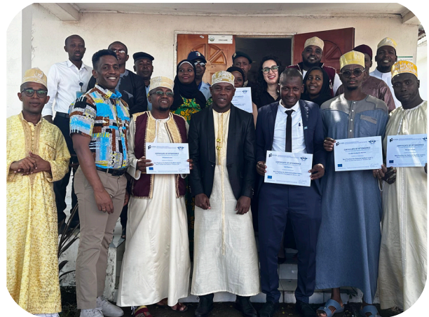
Photo de groupe des participants et des instructeurs de l'équipe du Projet.

La participation des stagiaires, associée aux retours d'information fournis par l'ANACM à la suite de l'activité, démontre l'impact positif que l'activité a eu et aura sur les activités de contrôle de qualité aux Comores et l'équipe du projet remercie l'ANACM pour son engagement.