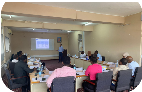
Les participants et l'un des instructeurs pendant une session en classe.

Après une première activité multilatérale en novembre 2023, l'Autorité de l'aviation civile de Tanzanie (TCAA) a de nouveau accepté d'accueillir des participants de l'Autorité de l'aviation civile de Somalie (SCAA) pour des activités de formation CASE II, ces deux activités de formation complémentaires étant organisées l'une à la suite de l'autre.