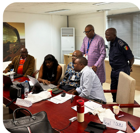
Les participants lors d'un exercice en groupe.

L'activité a été ouverte et clôturée par le directeur du transport aérien de l'Agence nationale de l'aviation civile (ANAC), qui a remercié l'Union européenne, la CEAC et le projet CASE II pour la sensibilisation aux normes internationales de l'aviation civile et pour le renforcement des capacités du Congo dans ce domaine de la sûreté.