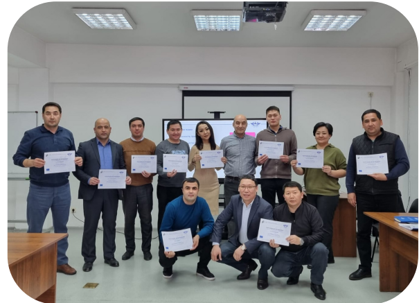
Photo de groupe des participants à la fin de l'activité.

Deux activités de formation multilatérales supplémentaires sont prévues au cours de ce trimestre et au-delà avec les États partenaires d'Asie centrale, ainsi que deux ateliers régionaux plus importants, en partenariat avec TRACECA, afin de continuer à établir des relations avec et entre les États partenaires de la région.